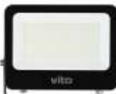
SAVA 200W 6000K Obj. kód 3022670