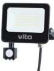
SAVA-S 30W 6000K Obj. kód 3022720