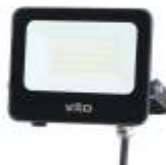
SAVA 30W 4000K, obj. kód 3022580 SAVA 30W 6000K, obj. kód 3022590