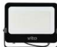
SAVA 300W 6000K Obj. kód 3022690