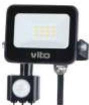
SAVA-S 10W 6000K Obj. kód 3022700