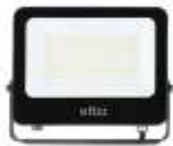
SAVA 100W 4000K, obj. kód 3022620 SAVA 100W 6000K, obj. kód 3022630