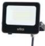
SAVA 20W 4000K, obj. kód 3022550 SAVA 20W 6000K, obj. kód 3022560