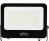
SAVA 150W 6000K Obj. kód 3022650