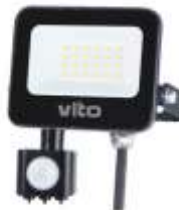
SAVA-S 20W 6000K Obj. kód 3022710