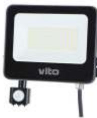
SAVA-S 50W 6000K Obj. kód 3022730