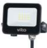
SAVA 10W 4000K, obj. kód 3022520 SAVA 10W 6000K, obj. kód 3022530