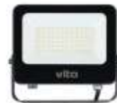
SAVA 50W 4000K, obj. kód 3022600 SAVA 50W 6000K, obj. kód 3022610