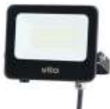
SAVA 20W 4000K, obj. kód 3022550 SAVA 20W 6000K, obj. kód 3022560