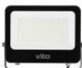
SAVA 150W 6000K Obj. kód 3022650