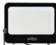
SAVA 300W 6000K Obj. kód 3022690