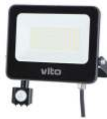
SAVA-S 50W 6000K Obj. kód 3022730