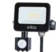
SAVA-S 10W 6000K Obj. kód 3022700