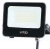
SAVA 30W 4000K, obj. kód 3022580 SAVA 30W 6000K, obj. kód 3022590