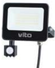
SAVA-S 30W 6000K Obj. kód 3022720