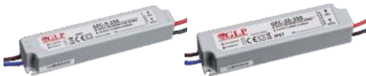
GPC-9-350, obj. kód 37200093 GPC-9-700, obj. kód 37200097