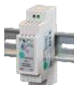
DIN15W12, obj. kód 34110015 DIN15W24, obj. kód 34120015