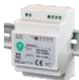
DIN30W12, obj. kód 34110030 DIN30W24, obj. kód 34120030