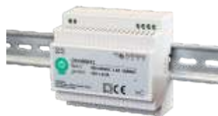
DIN100W12, obj. kód 34110100 DIN100W24, obj. kód 34120100