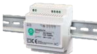
DIN60W12, obj. kód 34110060 DIN60W24, obj. kód 34120060